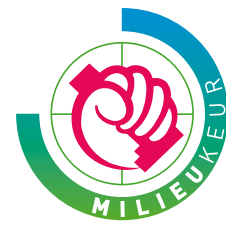
'Voor grote toepassingen' (origineel)