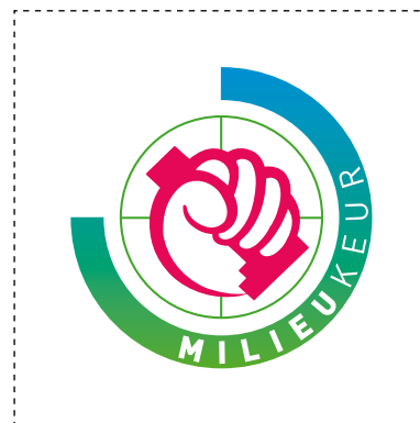
'Voor kleine toepassingen' (aangepaste beeldelementen)

Begrenzkader van 50 mm (Vrije ruimte en ø logo schaalt automatisch mee)